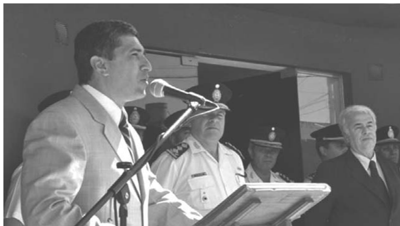
Crio. Gral. Alejo Paredes, Ministro de Seguridad de De la Sota

En igual sintonía, el actual Código de Faltas de la provincia es una ley provincial inconstitucional e ilegal que faculta a la institución policial a detener arbitrariamente bajo la figura del “merodeo”, y otorga al Comisario la potestad de juzgar y aplicar sanciones. Las actuales leyes de Lucha contra la Trata y contra el Narcotráfico, aprobadas por la legislatura provincial, mayoría