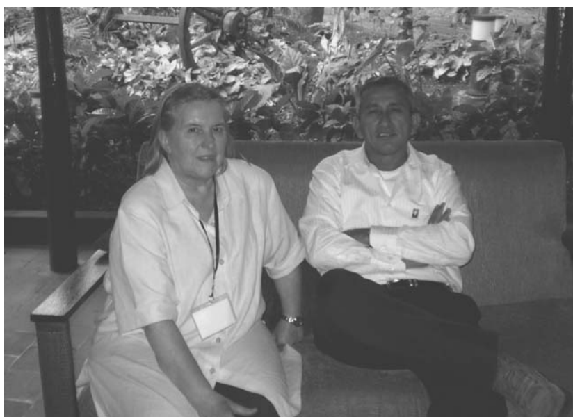
El comandante de las FARC-EP, Rubén Zamora en diálogo con Emilia Segotta

Una entrevista concedida el 30 de abril pasado por la Mesa de Negociaciones de las Fuerzas Armadas Revolucionarias de Colombia, que desarrolla su labor en La Habana, permitió un extenso diálogo con los comandantes Andrés Paris y Rubén Zamora del equipo negociador.