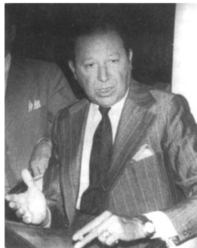
Ricardo Obregón Cano

ta Alexis Oliva “De la Sota llegó a la Penitenciaría sin un rasguño y bien vestido”, según recuerdan quienes con gran asombro lo vieron ingresar a la cárcel. «Siempre pensamos que alguna mano traviesa lo había mandado ahí, porque a los tipos que habían sido funcionarios, y más si pertenecían a la derecha peronista, los llevaban a Encausados y no a la cárcel de barrio San Martín”, recuerda uno de los ex presos políticos. Allí, en Encausados, estaba el propio Coronel, acusado por los militares de mal manejo de fondos públicos. De la Sota no alcanzó a ser ingresado al penal, cuando tanto en el pabellón 6 como en el 8, los integrantes de organizaciones guerrilleras allí alojados, a pesar del