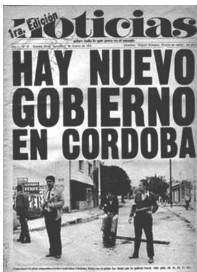
Los hechos relatados por el diario Noticias, el 27 de febrero de 1974