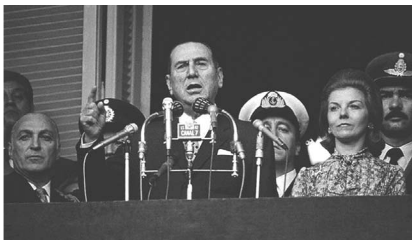
José López Rega, Ministro de Bienestar Social y fundador de la Triple A (Alianza Anticomunista Argentina), junto al presidente Perón y a la vice, Isabel Martínez de Perón

Los hechos que denunciamos ocurrieron así: 1) El día miércoles 9 se realiza un espectacular operativo de represión en el casco céntrico de la ciudad de Córdoba, con un tiroteo simulado, sin precedentes en la historia de la provincia, según expresiones de los vecinos 2) Se allana violentamente el local Luz y Fuerza, donde son apaleados y detenidos los trabajadores que realizaban gestiones ordinarias o retiraban vales para su asistencia médica. Igualmente se allana y detiene a militantes en el local del P.S de los trabajadores 3) se ataca el local del Partido Comunista, en Obispo Trejo 354, sin ningún motivo que lo justifique. Se dispara una impresionante ráfaga de ametralladora sobre el local ocupado y se hace volar la cerradura. Se golpea ferozmente con las armas (...) Se obliga a hombres y mujeres a arrojar al suelo y ametralladora en mano, los