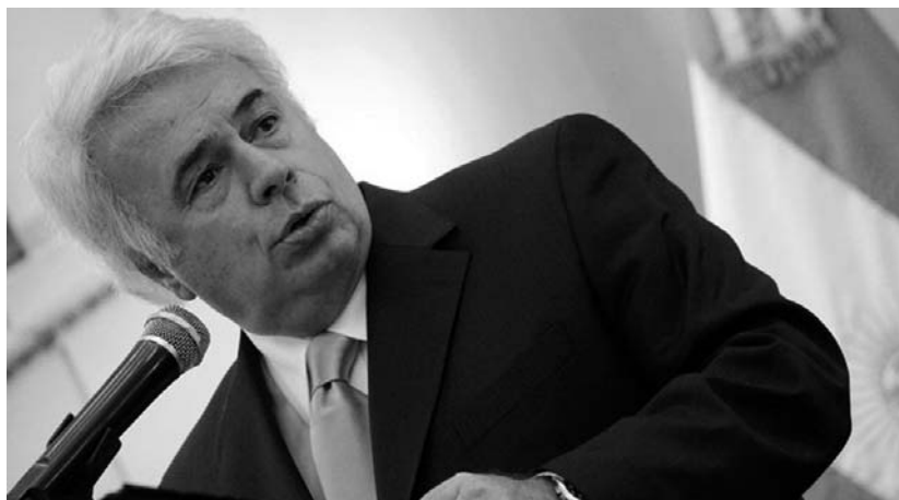
Juan Manuel De la Sota, actual gobernador de la pcia. de Córdoba

oficialista, adscriben al Código de Faltas y autorizan detenciones hasta por 60 días sin intervención de la Justicia. Según cifras que surgen de la Campaña Nacional contra la Violencia Institucional, durante el año 2011 se realizaron 73.100 detenciones. El 80 por ciento de estas son por aplicación del Código de Faltas. De ese 80 por ciento, el 78 por ciento es por “merodero”. Actualmente se llevan a cabo 200 detenciones por día, el 75 por ciento suceden en la capital provincial.